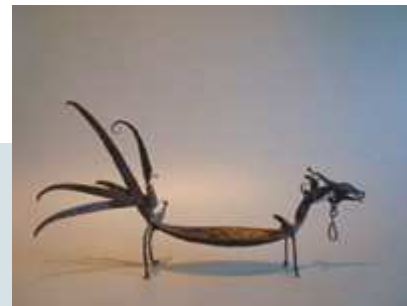
Sumatra, Lampung Besihung Zwartselbak voor zwart maken van tanden 37 cm