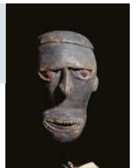
Casuarine Kust, Asmat Substituut Hoofd 24 cm hoog Herkomst: Collectie van Amelvoort. verzameld tussen 1959 en 1962