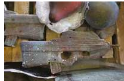
Spirit makers, 2015