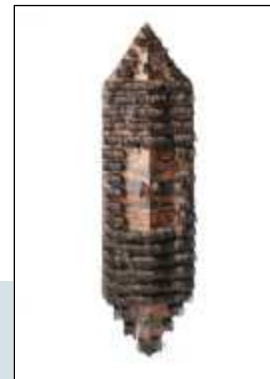
Dayak Schild 122 cm