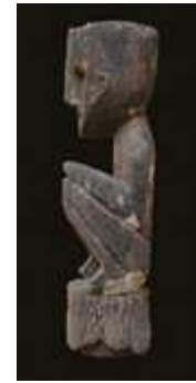
West Nepal Houten voorouder beeld van Rukum 64 cm Vroeg 20ste eeuw

TENTOONSTELLING: THE TRIBAL ART FROM THE FAR WEST IN NEPAL