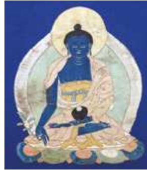
Tibet De Boeddha Baishayaguru H: 48 cm zijde appliqué, eind 17de eeuw