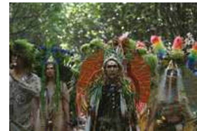
Still uit Matrix Botanica/Biosphere Above Nations, 2013