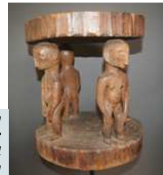
Philippines, Luzon Ifugao People Caryatid stool H: 35 cm