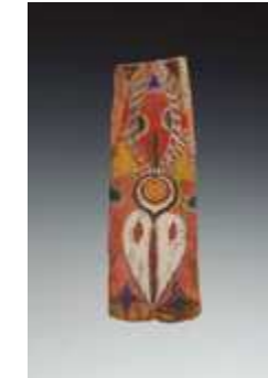
Noordoost Sepik, Abelam Panggal schildering Eerste helft 20ste eeuw