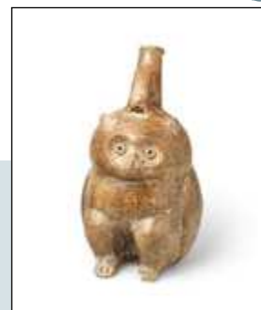
Ecuador Ceremoniële fluit/kruik in de vorm van een uil (God) Chorrera cultuur 1300-300 voor Christus