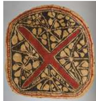
Nieuw Britannië, Raunsepna Area, Gazelle Peninsula, Baining tapa 86 h x 83 b Verzameld door Father Karel Hesse SVD

TENTOONSTELLING: MAGIE VAN DE TAPA EXPRESSIEVE SYMBOLIEK OP BOOMBAST