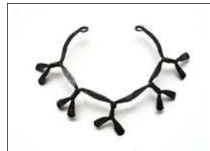
collier 'Keisha' gesmeed en gepatineerd ijzer