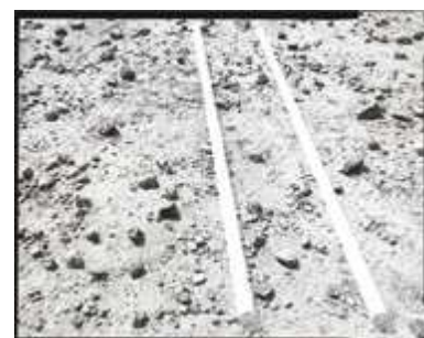
The Parallel I, 2013 zilvergelatine print, 10,2 x 12,7 cm