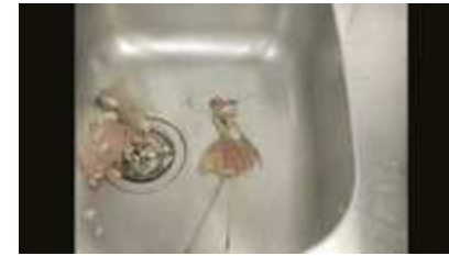
Little Dirt 1 & 2, 2005 Lo-fi stop motion animation