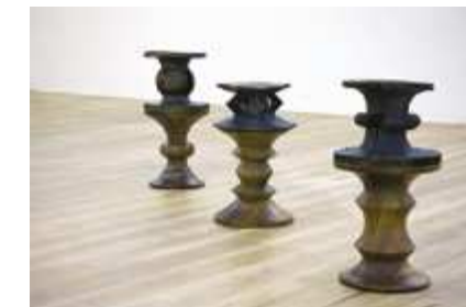
Socles (a,c,b), 2011 Assemblages van vintage Eames Walnut stools en antieke Mangbetu krukjes