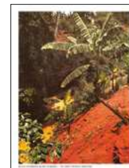
Environments, 2015 48,4 x 32,0 cm edition 1/5, 2 AP digital print on archival paper

In hetzelfde weekend is in het Spiegelkwartier bij meerdere antiquairs en galleries speciale tentoon- stelling te zien is. In the same weekend antique dealers and galleries in the Spiegelkwartier have a special exhibition. www.spiegelkwartier.nl