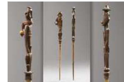
Houten kalk-spatula's, verzameld door J. Hoogerbrugge aan het Sentanimeer in 1957 Lengte's: 34 cm en 36.5 cm