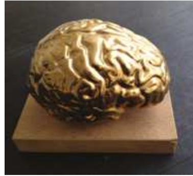
Golden Brain 2010 e.d. 10 13 x 17.5 x 13 cm Ceramics Gold glazed